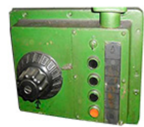
Коробка переключения 6P82-5