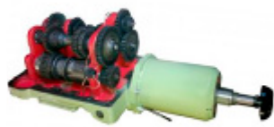
Коробка подач 6P82-4