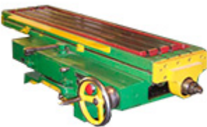
Стол и салазки 6P82-7